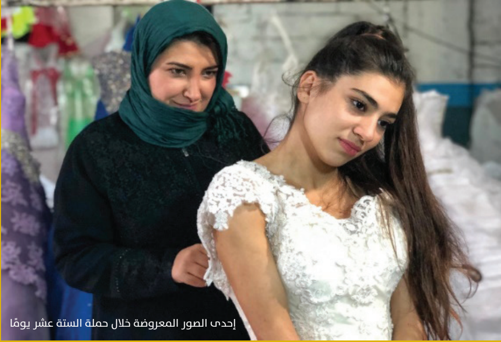
إحدى الصور المعروضة خلال حملة الستة عشر يومًا

#اسمعي أيضاً: معرض للصور من قبل نساء مركز صدي في غازي عنتاب - تشرين الثاني 2018